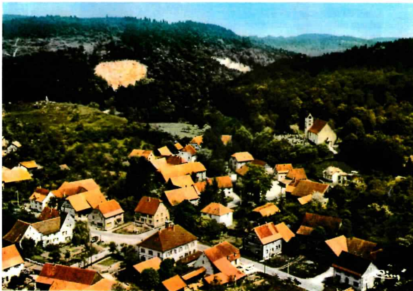
Vue aérienne du village dans les années 1970

Bulletin d'information n°02/2015 – JUILLET 2015