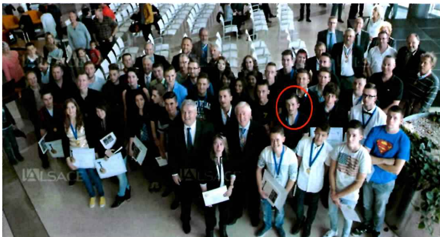
Les lauréats réunis autour des représentants du monde de l'apprentissage et des élus

C'est dans hall du conseil départemental que s'est déroulée la remise des prix aux lauréats du 22e concours « Un des meilleurs apprentis ».