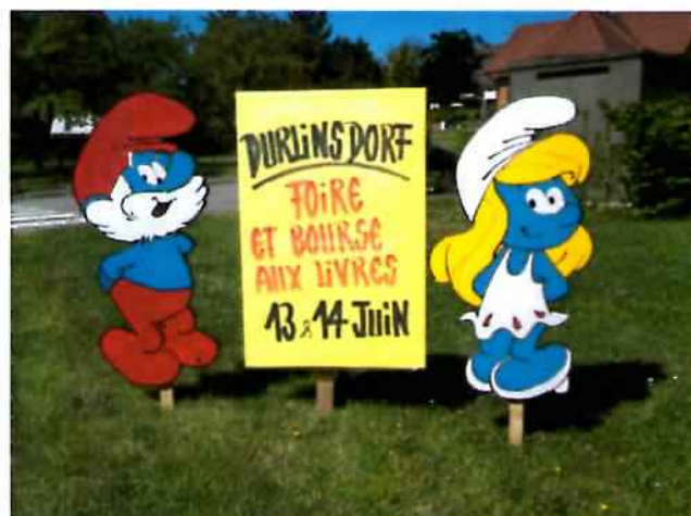
Un grand merci à Hugues Baur qui a réalisé et offert les décors pour la foire et bourse aux livres.